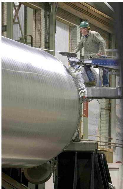
Навивание пучков спирального теплообменника производства Air Products

В настоящее время при производстве сжиженного газа чаще всего используется технология сжижения Air Products AP-C3MR™.